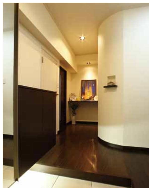
浴室を奥に移動させたことで、新たなゆとりが生まれた玄関ホール。角をアール状にカーブさせ、なめらかなラインが空間を優雅に見せています。靴箱の下にもさりげなく間接照明を設置。