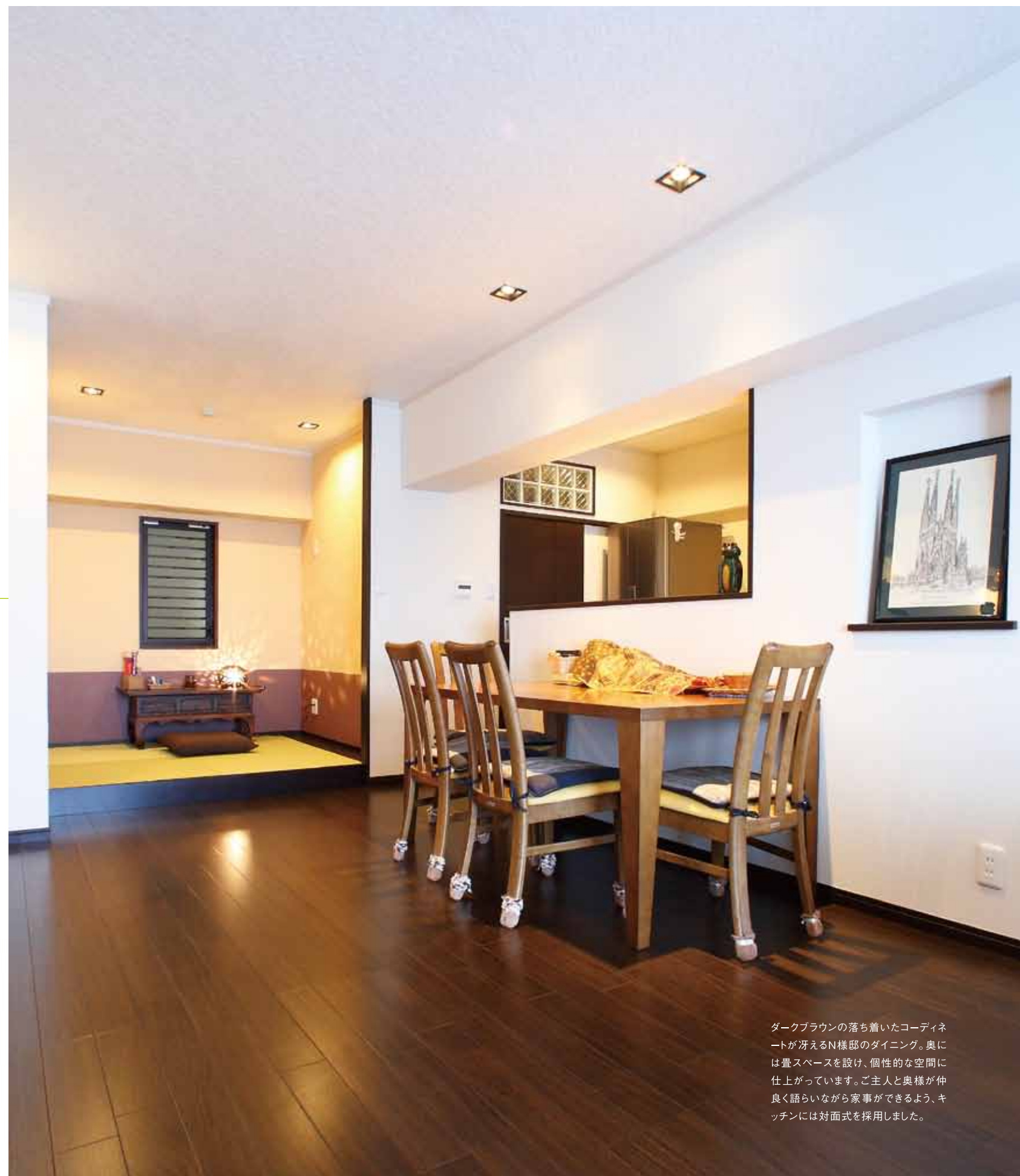
ダークブラウンの落ち着いたコーディネートが冴えるN様邸のダイニング。奥には畳スペースを設け、個性的な空間に仕上がっています。ご主人と奥様が仲良く語りながら家事ができるよう、キッチンには対面式を採用しました。

奥様がダークブラウンが好きということで、室内には随所にシックな色合いの材質が使われています。モダンな雰囲気のなかにも和のテイストがちりばめられ、リビングの窓にも和紙風のデザインがあしらわれた二重サッシが設置されています。また、ダイニングの隣りに設けられた畳スペースも新しい発想。15センチほどの小上がりにしたことで、室内にアクセントが生まれ、畳に座ると心身がやすらぐ癒しのスペースです。