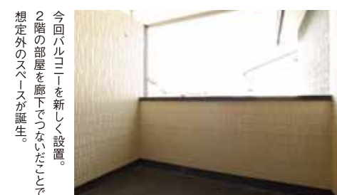
今回バルコニーを新しく設置。2階の部屋を廊下でつなぐことで、想定外のスペースが誕生。

4面採光が魅力。バルコニーに隣接 仲がよい二人の息子さんの部屋。4面の壁に窓が設けられ、バルコニーへも直接出られます。