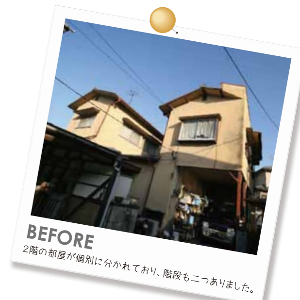
BEFORE 2階の部屋が個別に分かれており、階段も二つありました。

場所に設置され、しかもキッチンや浴室の配置までガラリと変わって、とても使いやすい間取りになっていました。と喜びの奥様。そこからはプランづくりが楽しくなり、自らもアイデアを出していったといいます。外壁にもこだわり、マリナホームの担当者と一緒にいろんな住宅地を巡りながら、わが家に見合う色を見つけたら、マリナホームの柔軟な対応のおかげで「まるで新築に住み替えたみたい」と語る笑顔がとても印象的でした。