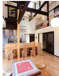
(右上)姉の部屋はスタイルある空間。プライベートな時間も楽しめる。(右下)以前より軒を長くした外観。(上)欄間を随所に飾った和モダンなLDK